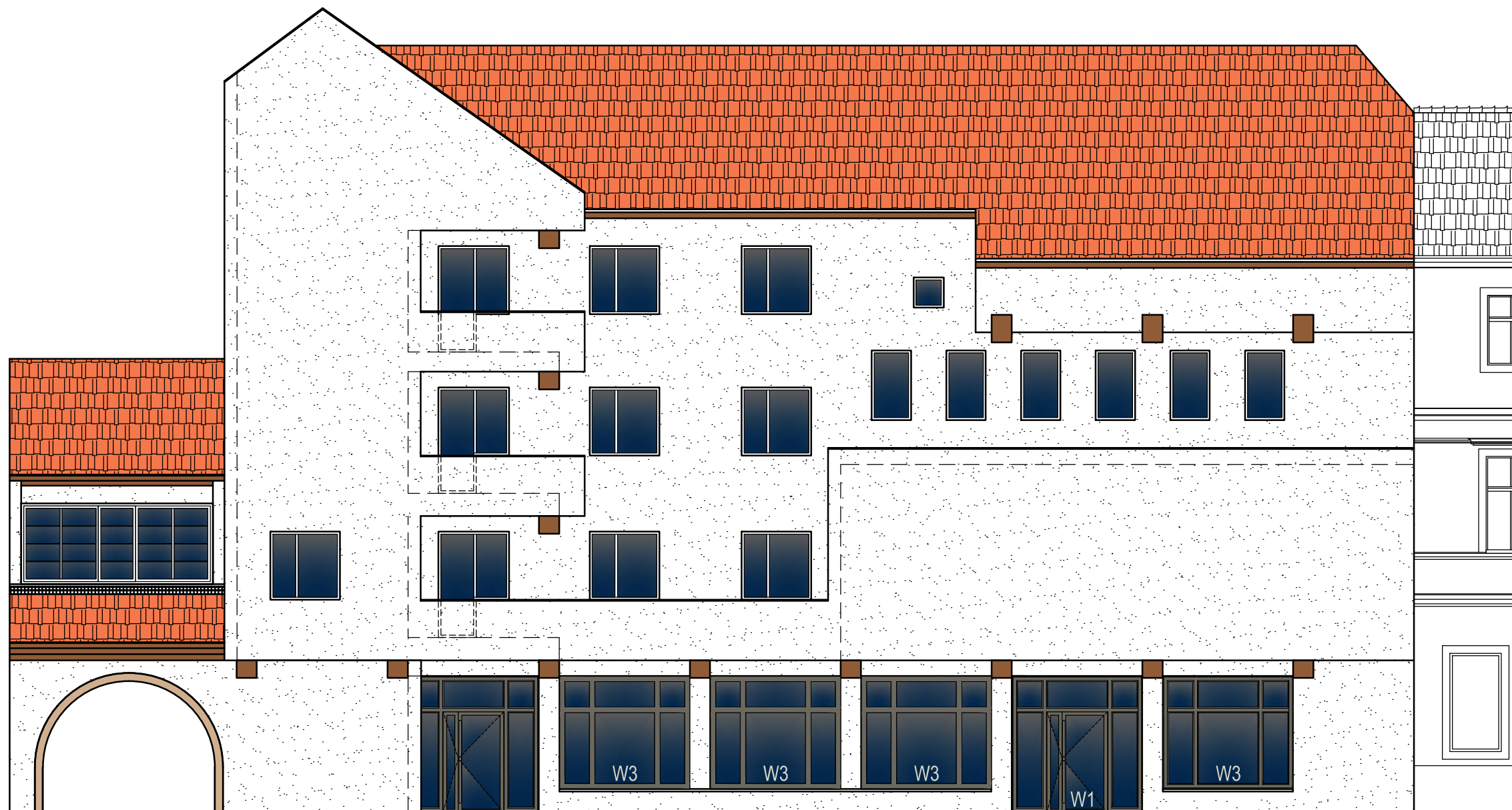
ELEWACJA FRONTOWA B-C